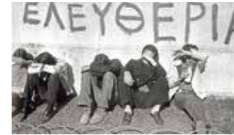
unten: Studenten der Athener Universität, geblendet vom Scheinwerferlicht des Militärs vor einer Wand mit der Schriftzug »Freiheit«