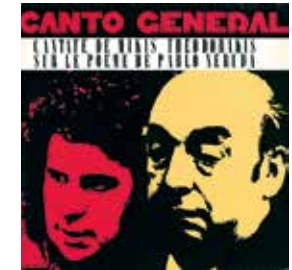
links und unten: Mikis Theodorakis komponiert im Exil 1970 den Soundtrack zu Costas Gavras Film »Z« und vertont den »Canto General« seines Freundes Pablo Neruda.