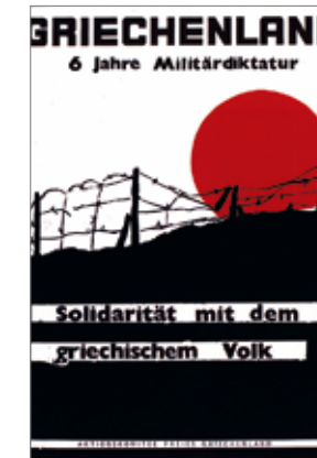
oben und rechts: Solidaritäts- und Protestplakat aus Deutschland