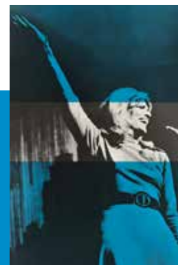
unten: Konzert im Rahmen der Jugendkonferenz der IG Metall 1968 in Essen, organisiert von der Arbeitsgemeinschaft der Jungsozialisten der SPD und der Jugendorganisation der Zentrumsunion EDIN