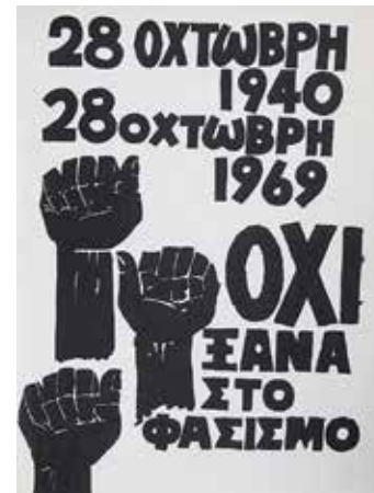
links: Das Plakat »Nie wieder Faschismus« spielt auf das italienische Ultimatum an Griechenland anno 1940 an.