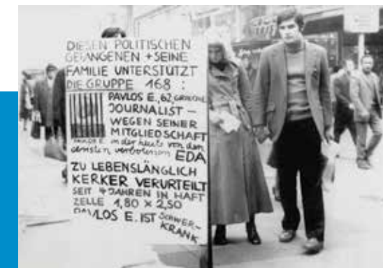
Abb.: Titel: ASKI, ASKI (2), Quelle: AdSD (2), ASKI, Quelle: DoMid-Archiv, Köln, Quelle: AdSD (2), ASKI (v. l. n. r.)